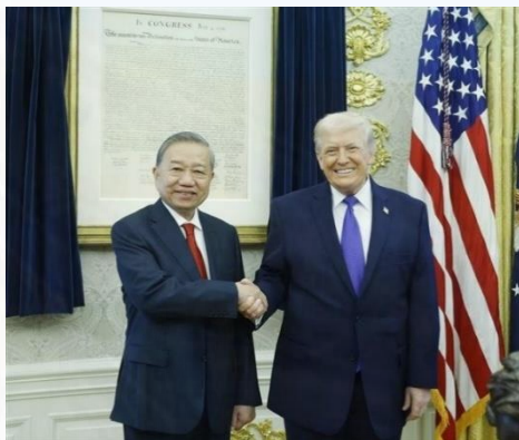
Tổng Bí thư Tô Lâm gặp Tổng thống Hoa Kỳ Donald Trump.