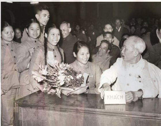
Chủ tịch Hồ Chí Minh nói chuyện với đại biểu thanh niên xung phong dự Đại hội Thanh niên xung phong chống Mỹ cứu nước toàn miền Bắc (tháng 1-1967).

Chính vì vậy, Người luôn coi trọng giáo dục, rèn luyện đạo đức cho thế hệ trẻ. Một mặt, Hồ Chí Minh khẳng định vai trò và sức mạnh của thanh niên, nhưng mặt khác, Người cũng thẳng thắn nêu lên những nhược điểm, những thiếu sót của thanh niên. Đó là sự thiếu từng trải, thiếu kinh nghiệm trong cuộc sống, một số chưa chịu khó học tập, mắc bệnh hình thức, bệnh cá nhân, tự cao, tự đại... Người yêu cầu mọi thanh niên phải chống tâm lý tư lợi, ham sung sướng, tránh khó nhọc, chống thói quen xem khinh lao động, nhất là lao động chân tay; chống bệnh lười biếng, xa xỉ; chống kiêu ngạo, giả dối, hình thức, khoe khoang... Phát huy mặt mạnh, khắc phục điểm yếu là con đường để tự hoàn thiện nhân cách của thanh niên. Muốn làm được điều đó, thanh niên phải không ngừng tu dưỡng, rèn luyện và học tập để làm người và phụng sự Tổ quốc, phụng sự nhân dân.