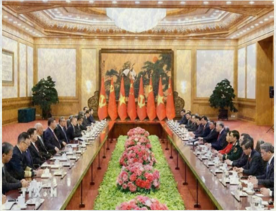
Tổng Bí thư, Chủ tịch nước Tô Lâm hội đàm với Tổng Bí thư, Chủ tịch nước Trung Quốc Tập Cận Bình

Trong thời gian chuyển thăm, Tổng Bí thư, Chủ tịch nước Tô Lâm đã có các cuộc hội đàm với Tổng Bí thư, Chủ tịch nước Tập Cận Bình và các cuộc hội kiến với Thủ tướng Quốc Vụ viện Lý Cường, Ủy viên trưởng Ủy ban thường vụ Nhân đại toàn quốc Triệu Lạc Tế, Chủ tịch Chính hiệp toàn quốc Vương Hộ Ninh và có nhiều hoạt động quan trọng khác.