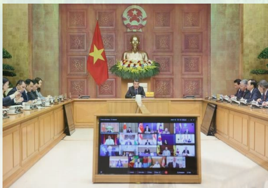
Thủ tướng Lê Minh Hưng đề xuất 3 định hướng hợp tác quan trọng để giải quyết các vấn đề năng lượng và duy trì chuỗi cung ứng

Khẳng định Việt Nam đang nỗ lực hướng tới mục tiêu phát thải ròng bằng 0 vào năm 2050, Thủ tướng Chính phủ Lê Minh Hưng đề xuất 03 định hướng hợp tác quan trọng: (1) tăng cường hợp tác và phối hợp chính sách nhằm đa dạng hóa nguồn cung năng lượng, thuận lợi hóa thương mại và duy trì ổn định chuỗi cung ứng; (2) nâng cao tự chủ chiến lược và năng lực chống chịu thông qua phát triển hạ tầng năng lượng, tăng cường dự trữ chiến lược và chuyển giao công nghệ; (3) đẩy nhanh triển khai hiệu quả các dự án hợp tác trong khuôn khổ AZEC.